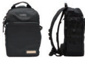
LC-192: Zaino per il trasporto