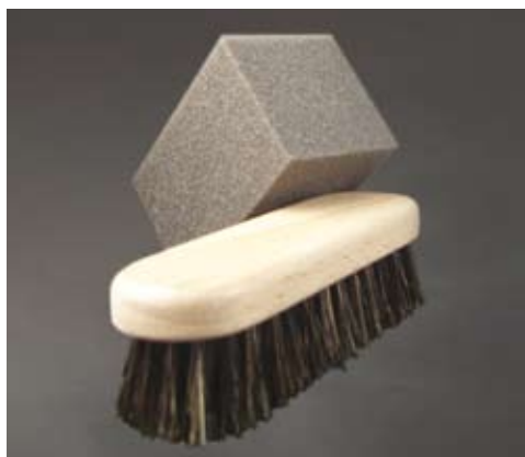
Spugnetta e spazzolina in crine di cavallo.